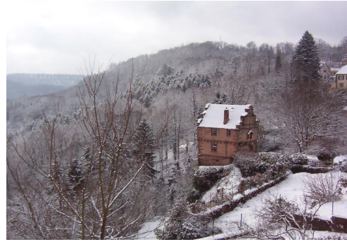
Maison des Paiens—La Petite Pierre