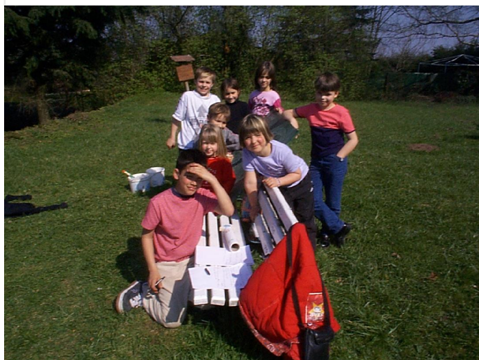
Enfants Animation Avril 2002